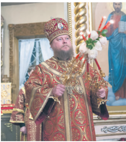
Дорогие братья и сестры, Христос воскрес!

В этот чудный праздник светлого Христова Воскресения каждый человек на земле принимает от Господа Бога дар радостной, блаженной вечности. Христос воскрес! – этим возгласом в душе христианина пробуждается неимоверная сила жить и свершать великие дела, потому что у жизни человека появляется сверхъестественный смысл, каждому верующему Господь обещает воскресение из мертвых, спасение и жизнь в Его Небесном Царстве. Больше нет страха и недоумения о том, что же нас ждет за порогом земной жизни. Господь воскрес, а значит и страшной смерти больше нет, есть только переход от временного к вечному, земная кончина становится началом небесного вечного бытия с Господом Иисусом Христом!