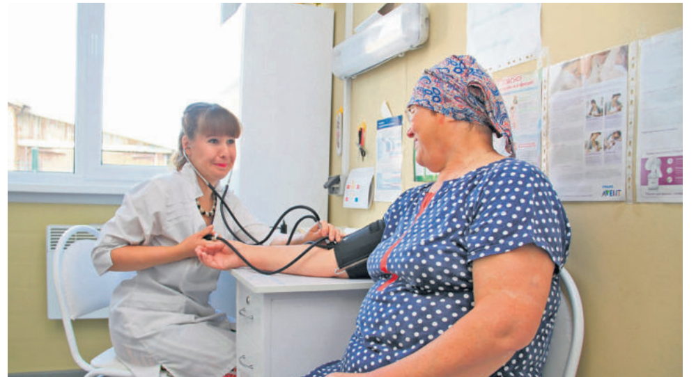
Подготовлено по заказу управления печати и массовых коммуникаций Алтайского края.

«Знаю, насколько важны для жителей по всему краю все изменения, которые касаются близкой и нужной каждому сферы – здравоохранения. Поэтому продолжаем вкладывать и в строительство медучреждений, и в обновление оборудования, и в обучение медиков, и в создание для них комфортных условий работы и в городах, и в селах», – отметил губернатор Алтайского края Виктор Томенко.