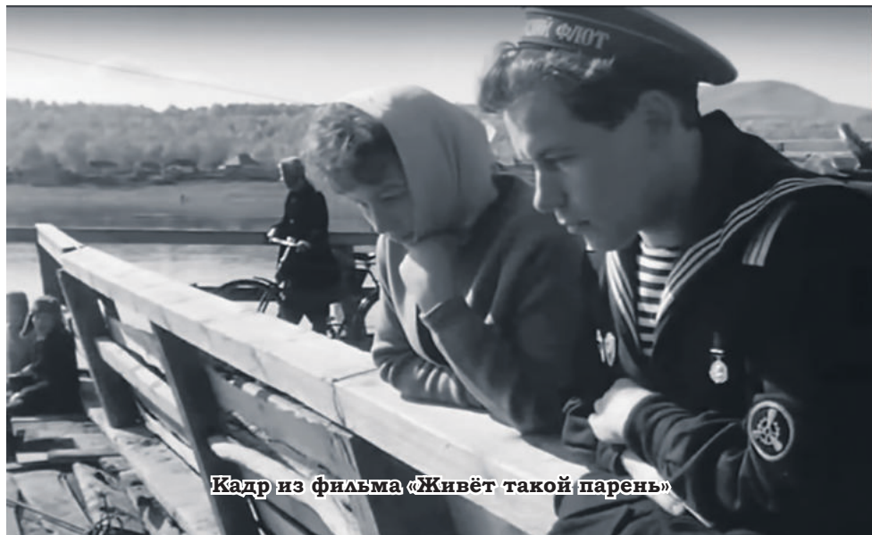
Кадр из фильма «Живёт такой парень»