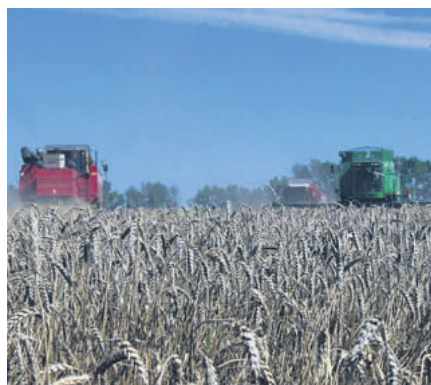
Подготовлено по заказу управления печати и массовых коммуникаций Алтайского края

Кроме того, в Алтайском крае началась и уборка льна-долгунца. В Троицком районе, к примеру, он убран с площади 500 гектаров, это четверть от общей площади посева.