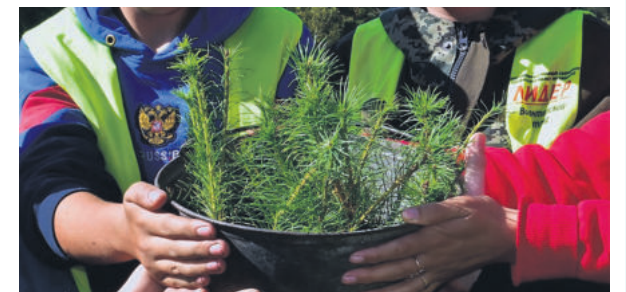
Подготовлено по заказу управления печати и массовых коммуникаций Алтайского края

В Министерстве природных ресурсов и экологии Алтайского края напомнили: в этом году в нашем крае посадка деревьев прошла в 25 лесничествах края на площади 524,4 гектара. Всего в рамках патриотической акции высажено 1531,2 тысячи штук семян разных пород. В акции приняли участие порядка трех тысяч жителей края.