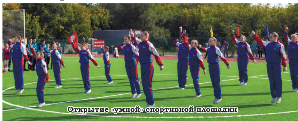
Открытие «умной» спортивной площадки

партнерства. Строительство многофункциональной ледовой арены в Рубцовске началось осенью 2018 года. Отправной точкой для его начала послужило концессионное соглашение, которое в июне 2018 года подписали Министерство спорта Алтайского края и ООО «Арена». В рамках соглашения 121,7 миллиона рублей на строительство ледовой арены