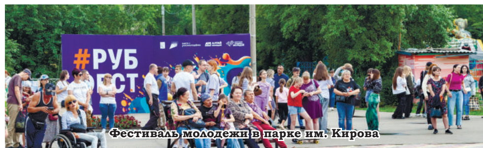
Фестиваль молодежи в парке им. Кирова

В 2020-ом в Рубцовске открыли ледовый дворец «Гимаев Арена». Это стало долгожданным событием для всех горожан и явилось примером государственно-частного