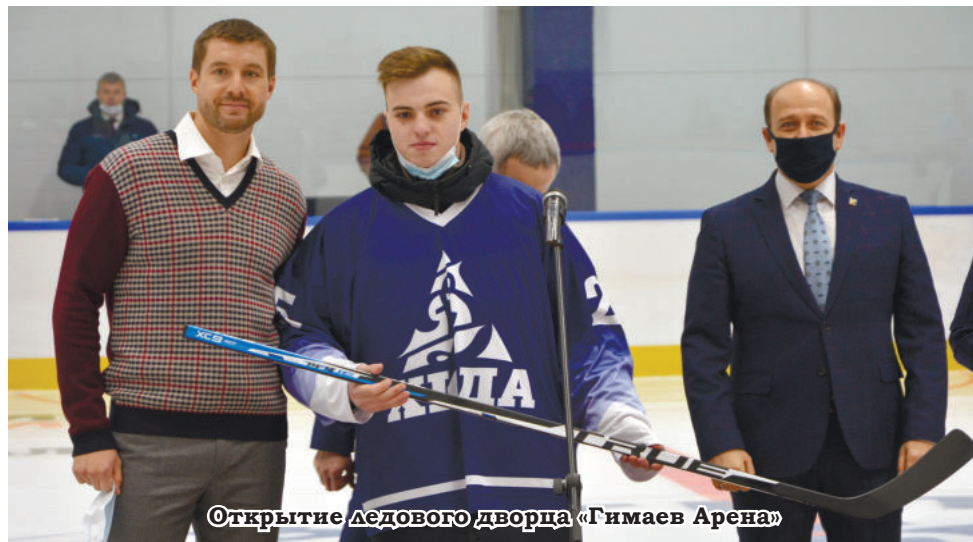
Открытие ледового дворца «Гимаев Арена»