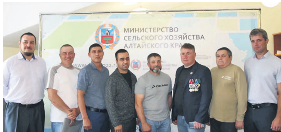
Подготовлено по заказу управления печати и массовых коммуникаций Алтайского края

В этом году Алтайский край впервые участвует в федеральном проекте «Агротиватор», получив рекордную поддержку – более 90 миллионов рублей. У ветеранов СВО еще есть шанс присоединиться к программе. Планируется дополнительный отбор претендентов. Гранты доступны для любых направлений сельхозбизнеса: до 7 миллионов рублей на животноводство и до 5 миллионов рублей на другие сферы. Обязательное условие – софинансирование грантополучателя не менее 10% от суммы гранта.